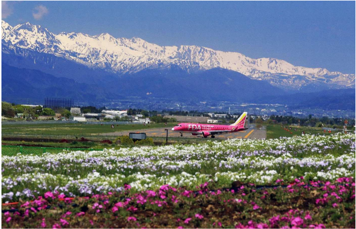
令和元年度信州まつもと空港写真コンクール 入選作品