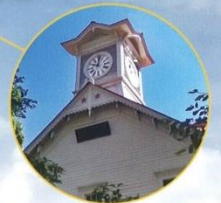
札幌時計台(札幌市)