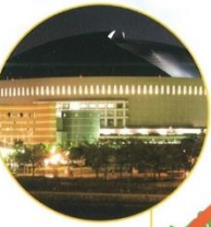
福岡ドーム(福岡市)