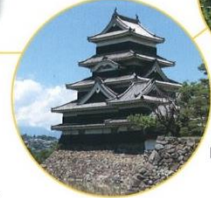
国宝松本城(松本市)