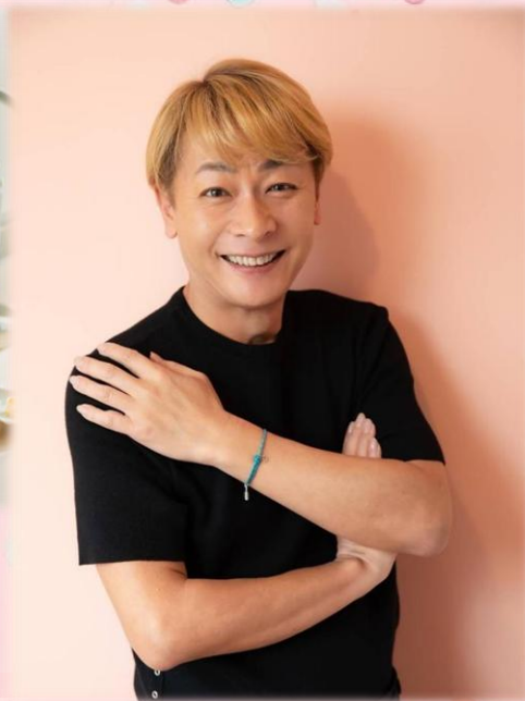
小椋ケンイチさん (おぐねえー)

タレントとして、テレビや、YouTube、通販番組などで活躍。LGBTQ関連の発信も行う美容家・メイクアップアーティストで、30年以上のキャリアを持ち、女優やタレントなど400名以上のヘアメイクを担当。Tokyo Girls Collectionでも話題を集める。飯田市産業親善大使として地域産業の発信にも尽力し、企業の商品開発支援や一般向けのメイク講習など幅広く活動している。