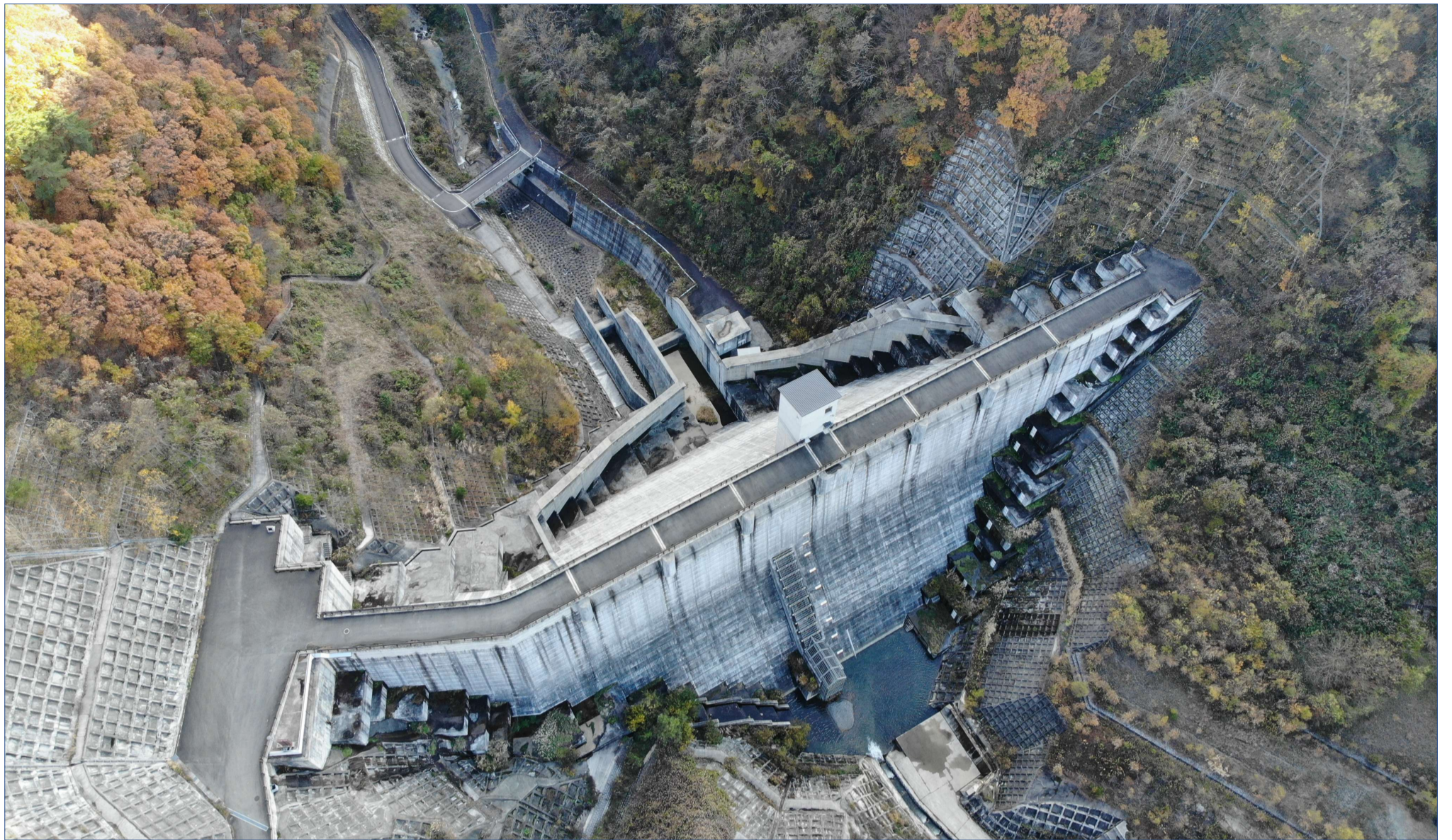
浅川ダム of 四季 (紅葉の浅川ダム)