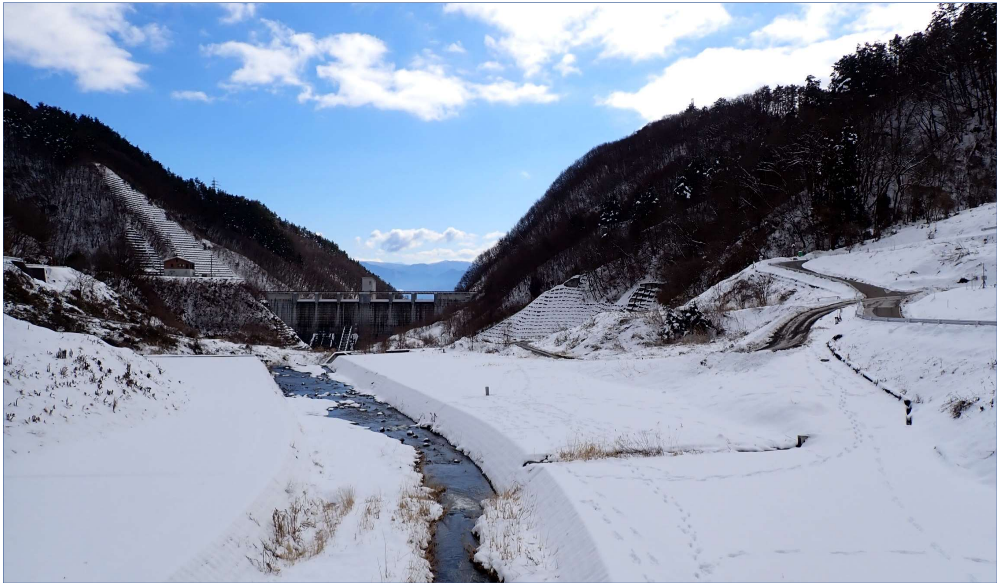
浅川ダムの四季（浅川ダムの冬景色）