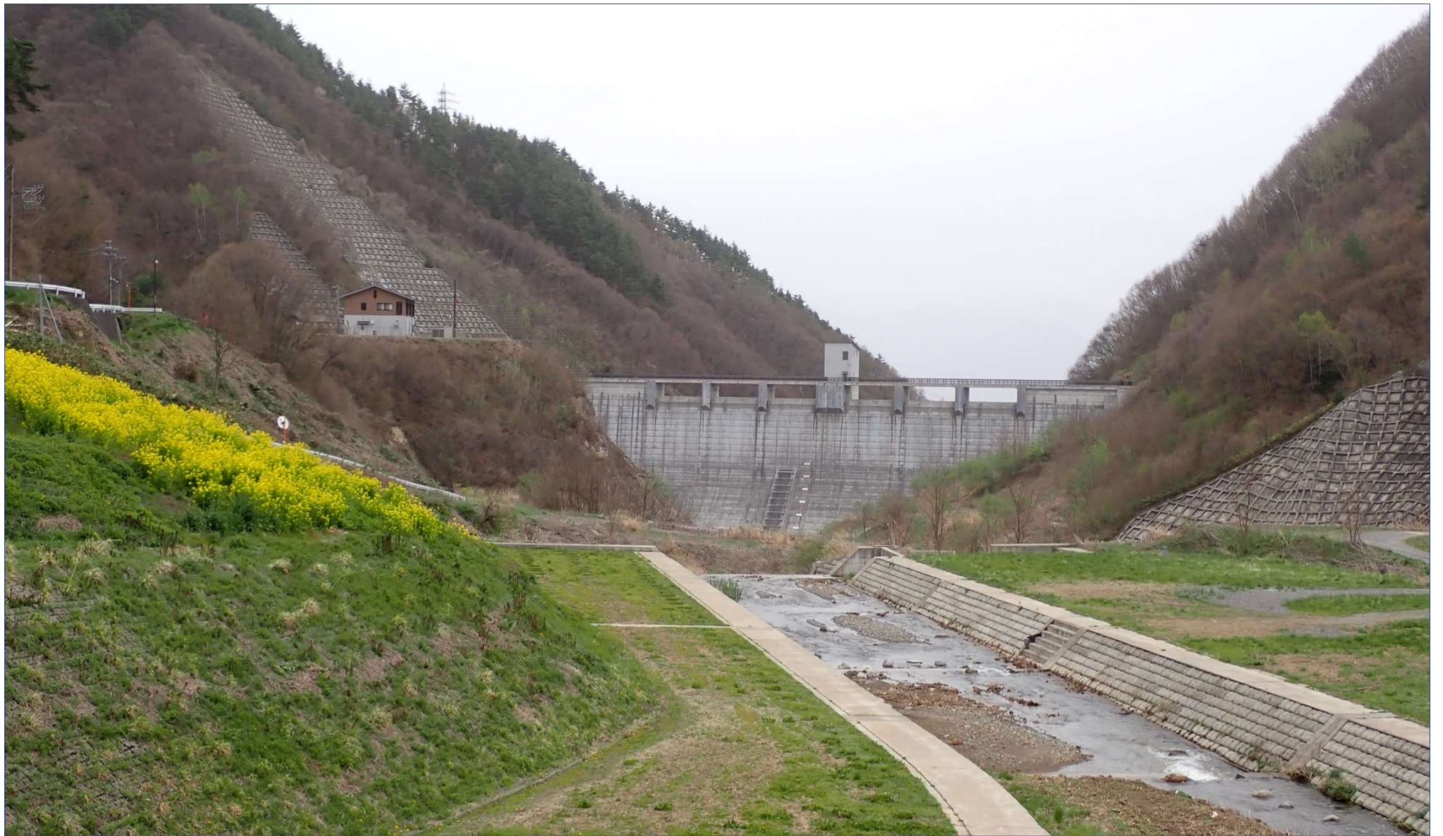
浅川ダムの四季 (浅川ダムの春)