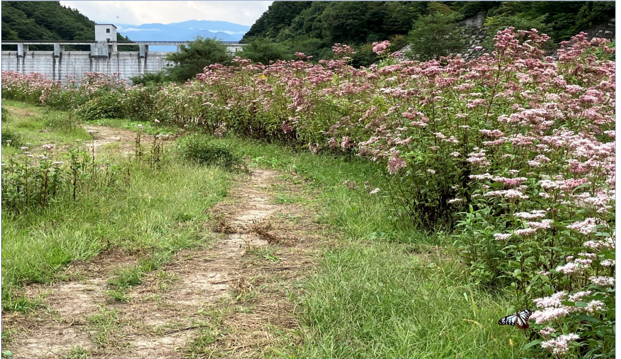
浅川ダムの四季（“フジバカマ苑”からのダム風景と“アサギマダラ”）