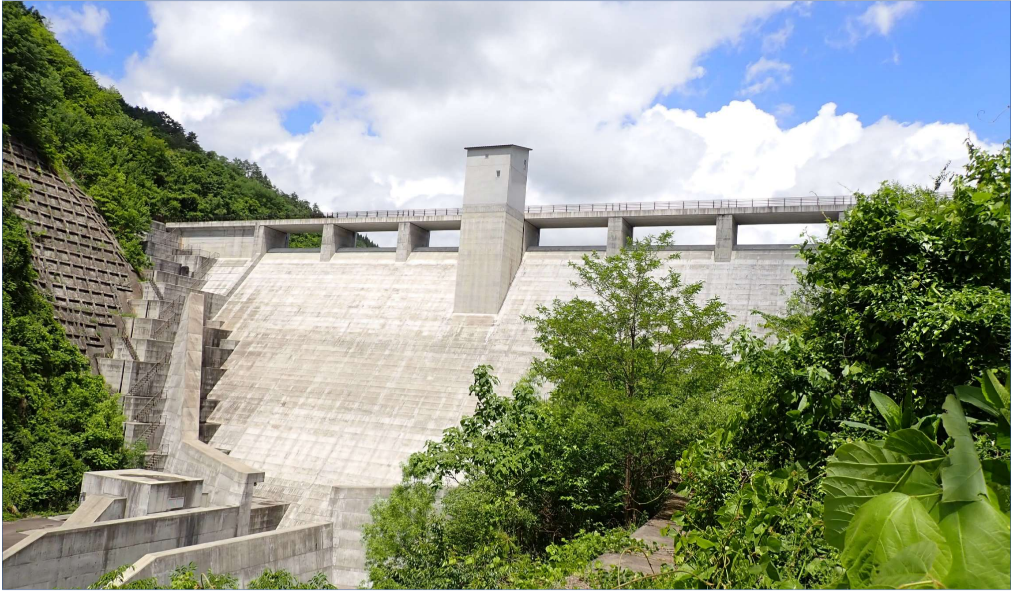
浅川ダム of 四季 (深緑の浅川ダム)