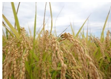
今年度栽培試験区の稲