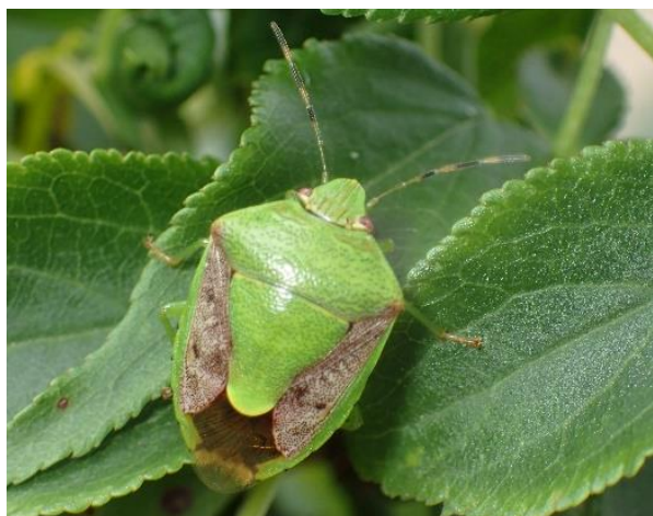
図1 チャバネアオカメムシ成虫