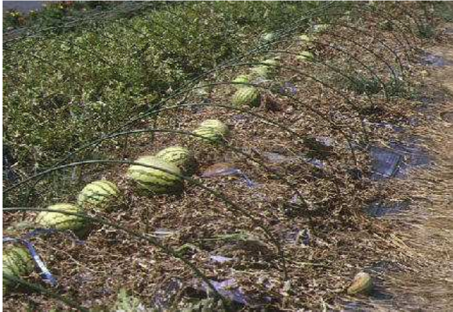
写真1: スイカ炭腐病が発生したほ場