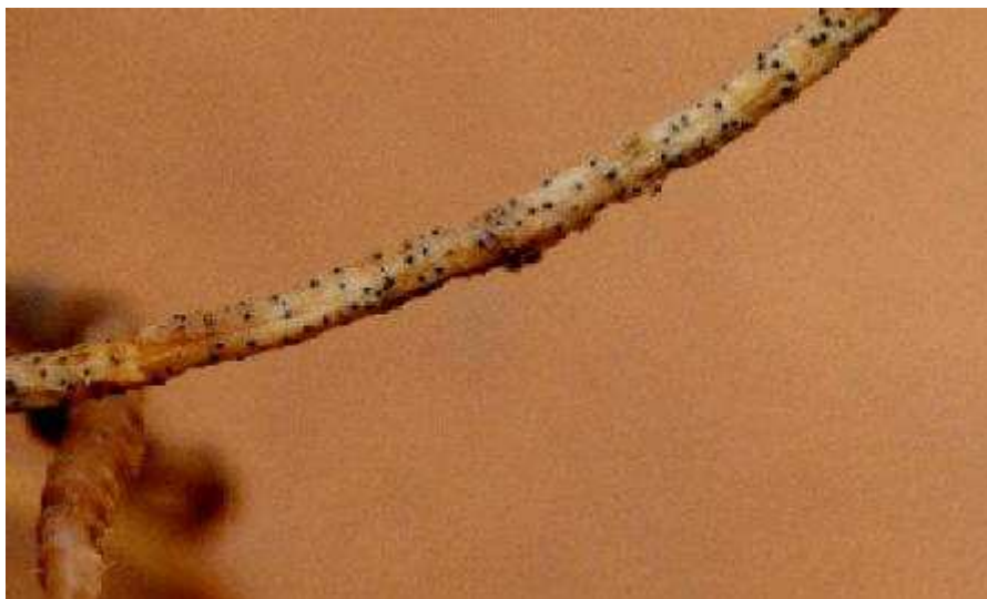
写真3: スイカ黒点根腐病が発病した株の根部