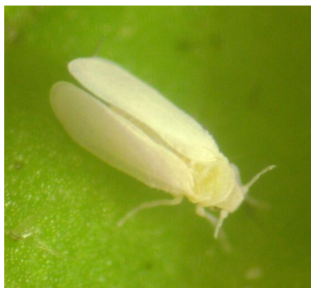
図1 タバココナジラミ成虫