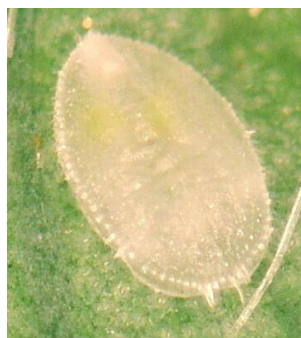
図4 オンシツコナジラミ 4 齡幼虫

長野県病害虫防除所 所長：中澤 伸夫 担当：吉沢しおり TEL：026-248-6471（直通） FAX：026-248-6473 E-mail：bojo@pref.nagano.lg.jp