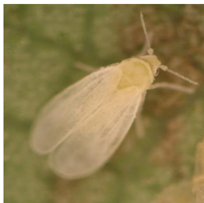
図2 オンシツコナジラミ成虫