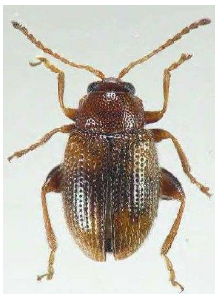
図1 タバコノミハムシ雄成虫