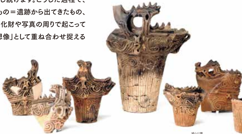
ひんご遺跡火焰型土器