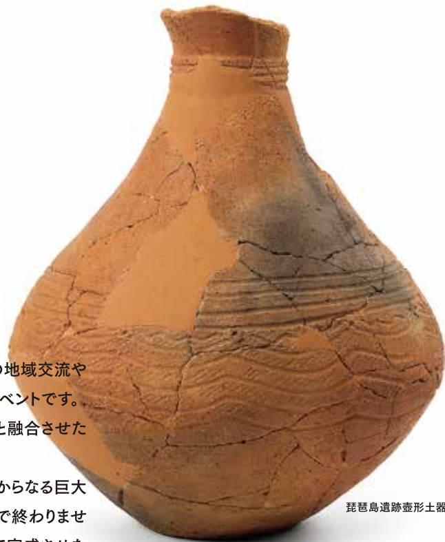
琵琶島遺跡壺形土器