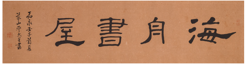
「海舟書屋」 嘉永5年(1852) 個人蔵・真田宝物館寄託