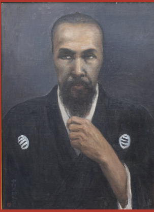
中村不折「佐久間象山像」 大正2年(1913) 信濃教育博物館蔵・信州高遠美術館寄託

令和6(2024)年度は、幕末の松代出身の儒学者で洋学にも通じた佐久間象山(しょうざん・ぞうざん、1811～64)の没後160年にあたります。これを記念して、象山の芸術家としての側面に焦点を当てる本展を開催いたします。