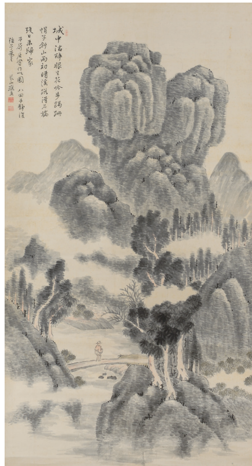
【左】紙本水墨山水図 個人蔵