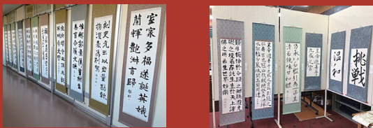
左から、屋代高等学校、屋代南高等学校の作品展示