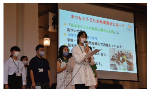
写真8 「まつもと子ども未来委員会」の発表