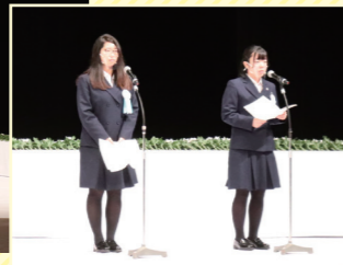
● 平和へのメッセージ発表

県出身の戦没者を追悼し平和を祈るため、1966年以降、毎年、戦没者追悼式を行っています。