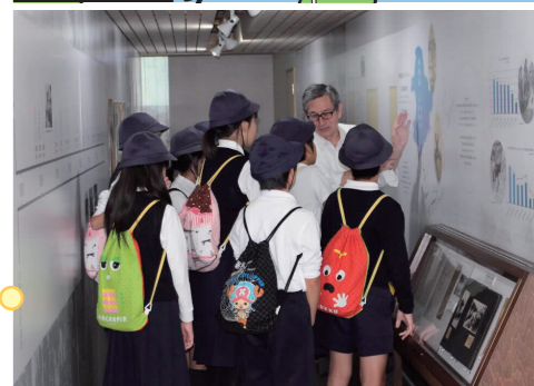
写真5 「満蒙開拓平和記念館」(阿智村)学校見学の様子