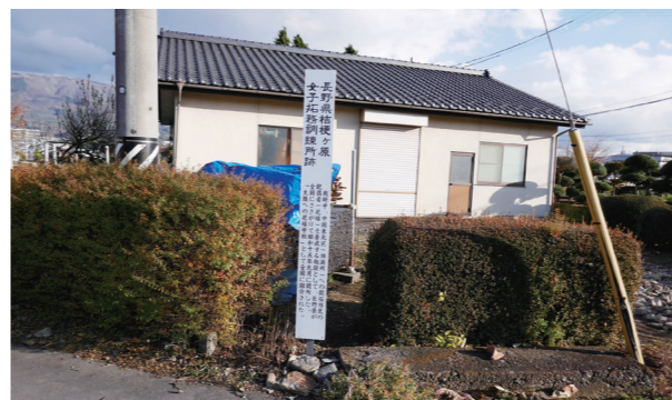
写真6 「桔梗ヶ原女子拓務訓練所」跡