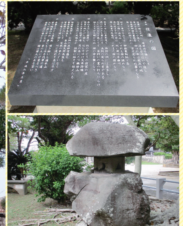
【建立年月日】 1964年4月6日 【石碑の大きさなど】 高さ330cm／幅300cm／重さ11,285kg