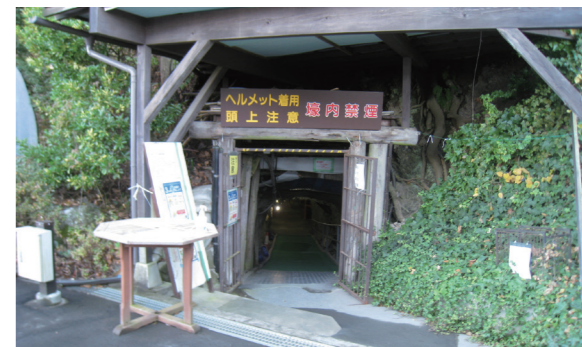
写真7 松代地下壕入口

労働力の不足を補うため、当時植民地であった朝鮮半島から多くの人々が連れてこられました。県内では、長野市松代の地下壕(「松代大本営」)、松本市の陸軍松本飛行場、里山辺地下工場等の工事、農地開拓などで、苦しい作業に従事し、その方々に耐え難い苦しみと悲しみを与えてしまいました。