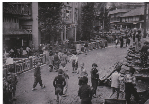
写真4 別所温泉を散策する疎開の子ども(上田市立博物館蔵)