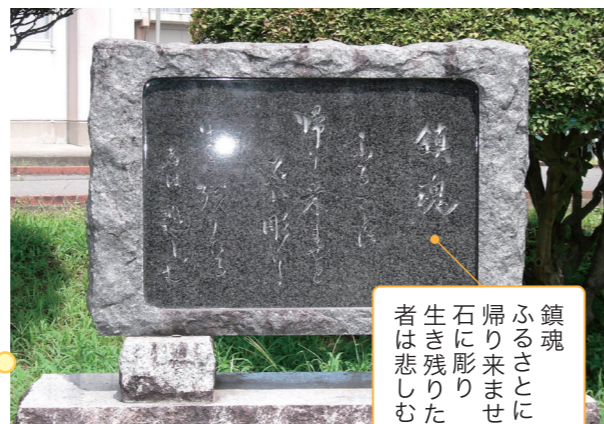
写真3 慰霊碑(伊那弥生ヶ丘高校)

終戦(8月15日)の2日前、午前7時頃。現在の東長野病院、長野駅、長野機関区、信濃川田跡跡、長野飛行場があった長野市大豆島、川合新田、松代町、篠ノ井駅などが、米軍艦載機により空襲を受けました。犠牲者は47名にのぼります。松岡神社(長野市松岡)の近くでは、防空壕が押しつぶされ、6才と9才の女の子、12才の姉に背負われた2才の男の子が犠牲となりました。県内では、同じ日に上田市、終戦の日には上田市、長和町が空襲を受けました。