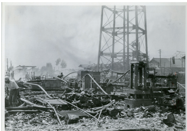
写真2 空襲で破壊された長野機関区 (「爆撃された長野機関区」長野県政史資料(写真集)19・事件・戦争・社会運動 長野県立歴史館所蔵)