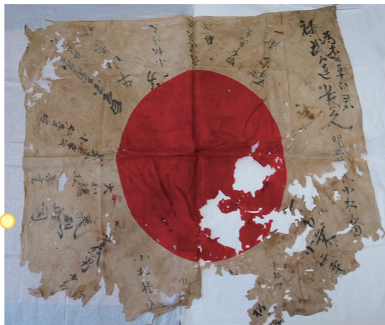
写真1 返還された日章旗(安曇野市豊科郷土博物館蔵)