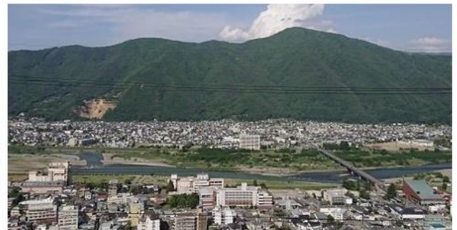
→ 城山からの現在の様子。ホテルなど高層建築も目立つ

万葉橋竣工当時の戸倉上山田温泉は、昭和42年(1967年)に城山遊園地開園、44年城山にケーブルカー運転開始、さらに45年には千曲川河川公園が完成するなど次々に観光施設が整備されました。また、41年10月から特急あさまが戸倉駅停車となり、旅館の中高層化の進展など活況を呈していきました。