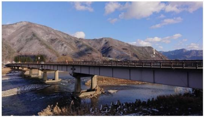
五里ヶ峰、葛尾山（左から）と万葉橋（左岸、堤防道路から）

一般県道聖高原千曲線の起点は、国道18号の戸倉上山田温泉入口交差点。温泉の玄関口である万葉橋は、茶色壁の上山田文化会館や歓迎アーチとともに、県道で戸倉上山田温泉に向かう人のランドマークになっています。河畔には多くの歌碑が立つ千曲川万葉公園や湯の里親水パークなど旅情を誘うスポットも。県道を直進し、城山の急こう配を上がると眼下に温泉街と千曲川が流れ行く善光寺平が望めます。