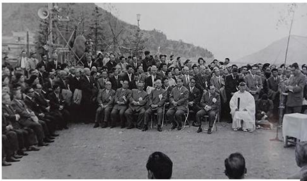
都市整備計画最後の懸案、万葉橋架設の起工式 (昭和38年10月)「写真集上山田の百年」

昭和38年(1963年)10月、旧戸倉町と旧上山田町(いずれも現在の千曲市)の都市計画事業と並行して万葉橋の架橋が具体化し、起工式が行われました。2年半の工事を経て、竣工は昭和41年(1966年)4月、事業費は約3億3千万円でした。