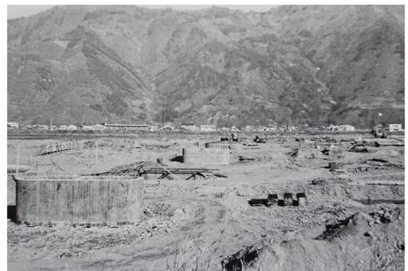
橋脚の建設が進む(昭和39年11月) 「写真集上山田の百年」