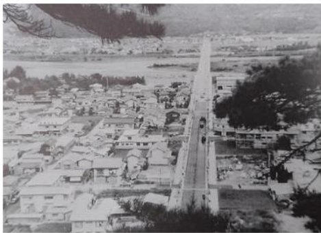
↑ 城山からの万葉橋と上山田温泉全景(昭和44年)(科野のいしぶみ 長野県建設業協会更埴支部)

万葉橋竣工当時の戸倉上山田温泉は、昭和42年(1967年)に城山遊園地開園、44年城山にケーブルカー運転開始、さらに45年には千曲川河川公園が完成するなど次々に観光施設が整備されました。また、41年10月から特急あさまが戸倉駅停車となり、旅館の中高層化の進展など活況を呈していきました。