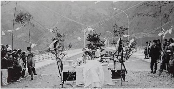
↑ 万葉橋の竣工式(昭和41年4月) → オープンカーで渡り初め(同上)「写真集上山田の百年」

昭和41年(1966年)4月15日、待望の竣工式が行われました。当時の上山田公民館報は、「地元、町、県関係者はじめ総勢430人が出席し、見物人も300人程度集まって、正に歴史的な竣工式が行われた。」と報じ、地域の大きな喜びを伝えています。竣工時の万葉橋は、朱色の高欄が千曲川と山々の景観に調和し、夜は水銀灯が灯るなど、観光地にふさわしい斬新な橋と好評でした。