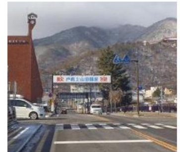
万葉橋から戸倉上山田温泉へ、左は上山田文化会館