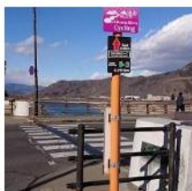
サイクリングコースの道標

「科野さらしなの里サイクリング推進委員会」が設定したサイクリングコース、戸倉上山田温泉カラコロ足湯を発着地点とする温泉街ループコースは、全長3.6km、40分かけてゆっくり走れる初級者コースです。万葉橋、千曲川万葉公園では自転車を降りての散策がお勧めです。