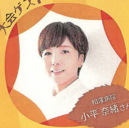
相澤病院 小平 奈緒さん