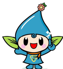
公式キャラクター「めぐるん」