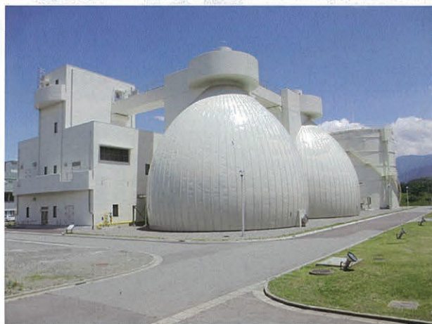
汚泥消化棟と消化タンク (1号・2号)