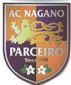
パルセイロのエンブレム