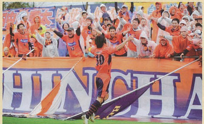
南長野運動公園総合球技場(長野市篠ノ井)でのJFLの試合風景