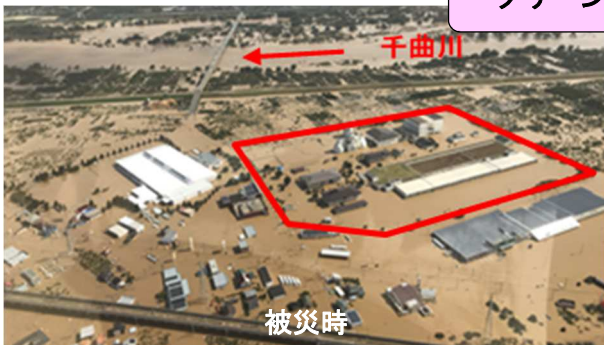
クリーンピア千曲全景

引き続き、災害にも強く、安心してご利用いただける下水道施設を目指して、管理と整備に取り組んでまいります。