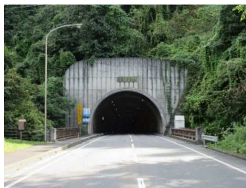
日高トンネル（長野市）