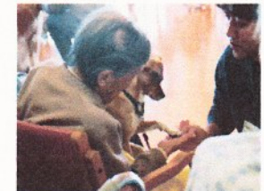
動物ふれあい訪問