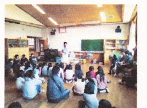
動物ふれあい教室(出前教室)