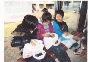
動物とのふれあい