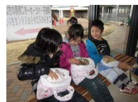
動物とのふれあい