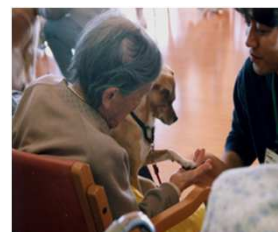
動物ふれあい訪問