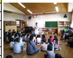
動物ふれあい教室(出前教室)