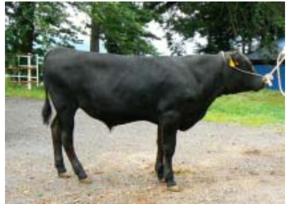
栄寿産子(栄寿×平茂勝×安福 8ヵ月齢 320kg)