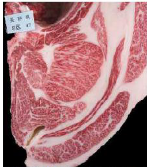
優良枝肉賞(血統:栄寿×福栄×安平)