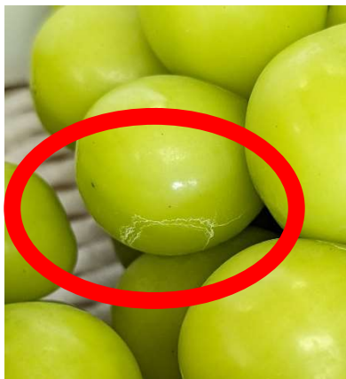
図 1 農薬による果面汚染