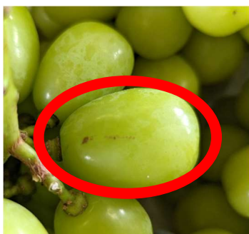
図 2 さびの発生した果実