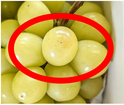
図4 かすり症が発生した果実