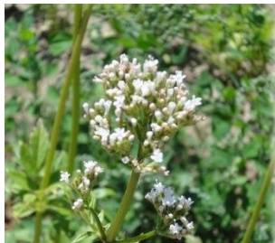
【カノコソウ：鎮静薬】