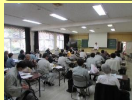
薬草の基礎を学ぶ座学研修会