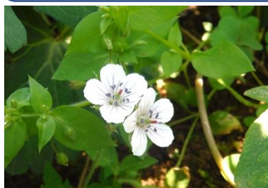
【ゲンノショウコ：整腸薬】