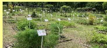
数多くの薬草を展示している薬草見本園（菅平）