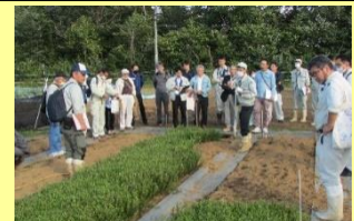
現地ほ場での栽培指導研修会