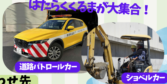
道路パトロールカー