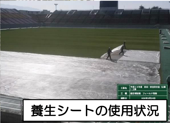
養生シートの使用状況