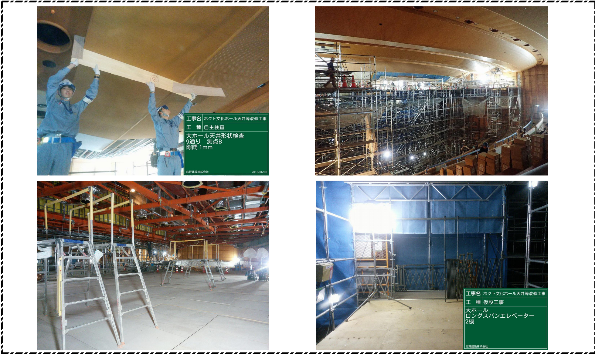
工事名 ホクト文化ホール天井等改修工事 工種 自主検査 大ホール天井形状検査 9通り 測点B 隙間 1mm 北野建設株式会社 2018/06/08