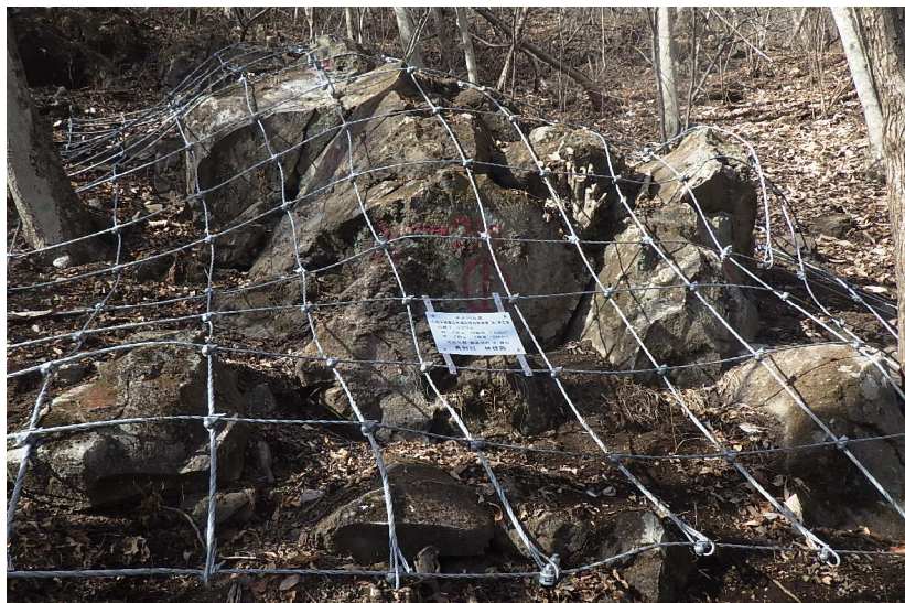
作業道(モノレール部)