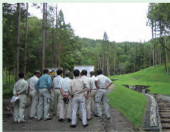
復旧治山事業の調査

7月9日～11日に長野地方事務所など11現地機関と復旧治山事業など13か所を調査しました。