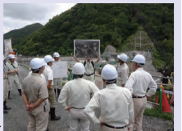
治水ダム建設事業の調査

7月14日～15日に長野建設事務所など11現地機関と治水ダム建設事業など5か所を調査しました。