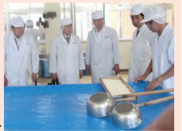
南安曇農業高等学校の調査

6月5日～6日に南信発電管理事務所など2現地機関と諏訪清陵高等学校附属中学校など4教育機関を調査しました。