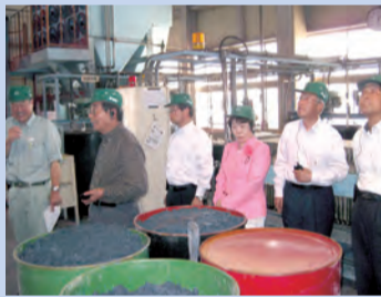
株式会社デリカ(松本市)の視察

5月27日～29日に松本地方事務所など10現地機関と株式会社デリカなど7か所を調査しました。