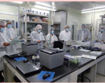
科学捜査研究所の調査

7月14日～15日に北信地方事務所など4現地機関と元気づくり支援金事業など5か所を調査しました。