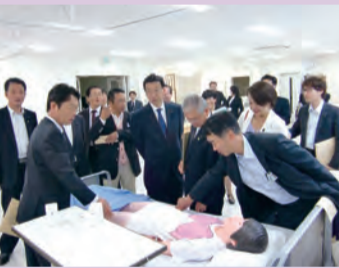
岡谷市看護専門学校(岡谷市)の視察

5月26日～28日に諏訪地方事務所など9現地機関と岡谷市看護専門学校など6か所を調査しました。