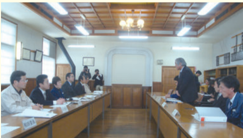
王滝村役場での調査

12月18日(木)、環境産業観光委員会は、御嶽山噴火災害による観光業や商工業など地域経済への影響を木曾町、王滝村で調査しました。