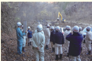
砂防堰堤の除石工事(王滝村鈴ヶ沢)の現地調査

11月7日(金)、危機管理建設委員会は、御嶽山噴火災害の災害復旧の状況を木曾町、王滝村で調査しました。