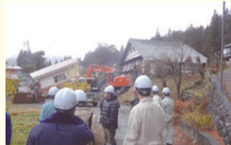
住宅被災状況の現地調査(白馬村神城)

12月1日(月)、危機管理建設委員会は、長野県神城断層地震の被災地域の状況を白馬村、小谷村で調査しました。