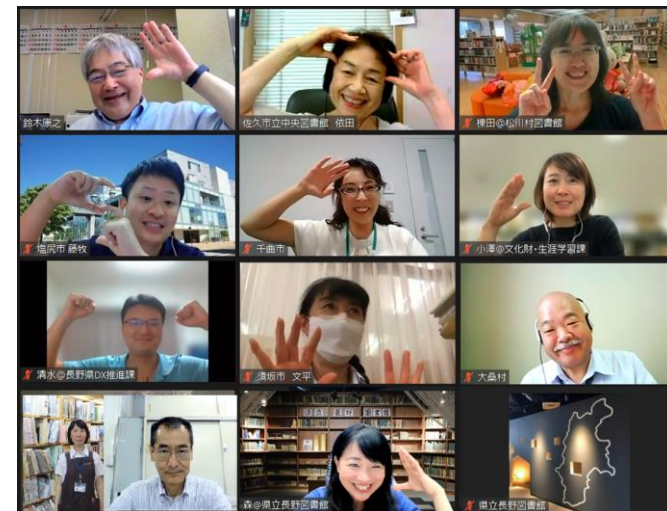
1年以上にわたり、多様な立場の関係者が粘り強く対話し続け、数々の困難を乗り越えてきました！