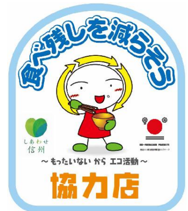
「食べ残しを減らそう協力店」ステッカー