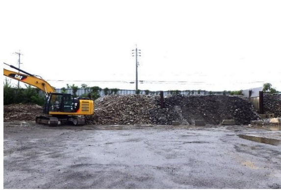
自社処分場 (コンクリート・アスファルト殻) 再生クラッシュラン 40~0mm

自体も変動し、工事種別によっても搬出される廃棄物が違いリサイクルに向けて、徹底した分別にこだわり混合廃棄物ゼロ、再資源化に向けてのひとりひとりの意識向上に努めています。自社処分施設の産業廃棄物置場の徹底した分別処理がリサイクル製品へと繋がる為、しっかりと管理しています。