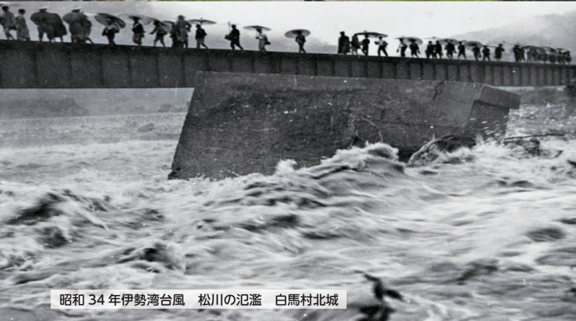
昭和34年伊勢湾台風 松川の氾濫 白馬村北城