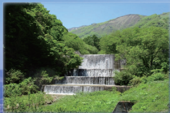
白馬村 飯田 不透過型堰堤