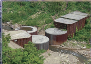
小谷村 奉納 セル型堰堤