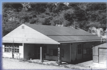
昭和39年 姫川砂防事務所所在地へ移転