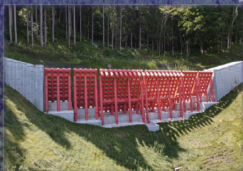
小谷村 来馬 鋼製スリット堰堤