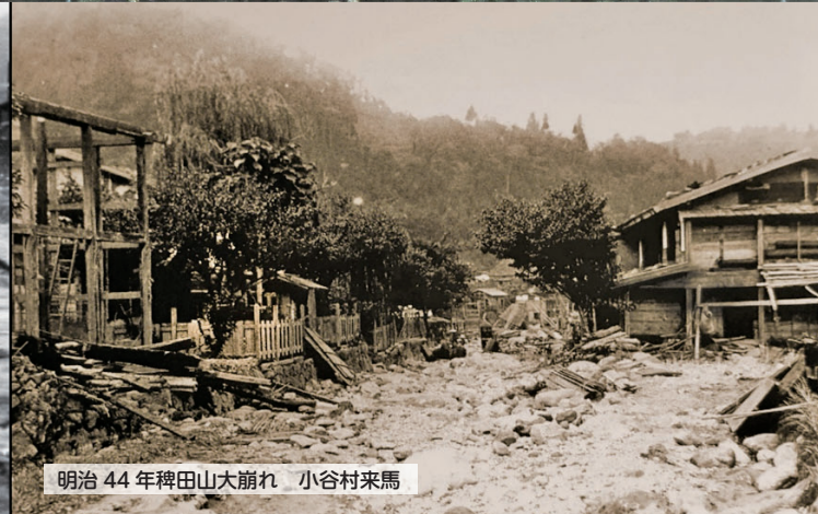
明治44年稗田山大崩れ 小谷村来馬