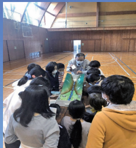
防災教育 白馬北小