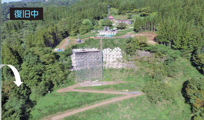
平成7年豪雨 地すべりによる中谷川の閉塞 (小谷村神久)