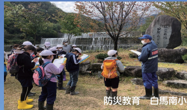
防災教育 白馬南小