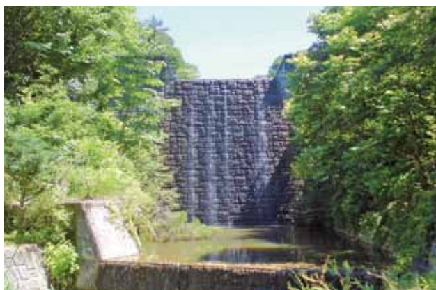
高さ16mのダムから落ちる滝は壮観です

高さ16mの大型堰堤と親水性を持たせた流路工411.0mの整備により、多彩な水辺空間を創出したほか、周辺に農村公園が整備されたことにより、東屋やマレットゴルフ場が整備され、訪れる人々の憩いの場となっています。