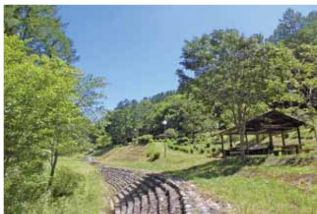
東屋やマレットゴルフ場が整備された流路周辺