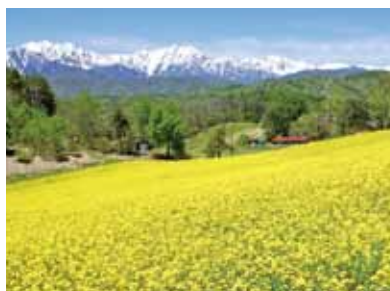
中山高原の菜の花畑

「新行」＝蕎麦と言うくらい蕎麦の里として有名です。昼と夜の寒暖差が大きい高冷地のため、風味のよい蕎麦が育ちます。お越しの際は手打ち蕎麦を是非ご賞味下さい。