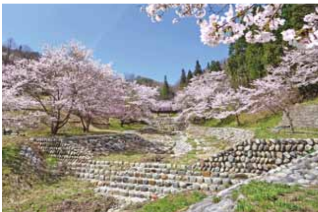
春は満開の桜が見事です

近年では、昭和44年から新たな砂防堰堤を設置し、その後順次流路工等も整備しました。さらに平成3年からは「水と緑の砂防モデル事業」として、浸食の著しい河岸の安定を図りながら、恵まれた自然環境とも調和した自然石積みによる床固工を整備しました。また、連携した活性化事業により周辺の荒廃農地も公園に整備され、地元有志によるラベンダー栽培が始められました。現在では、斜面に咲くラベンダーの紫が人々の目を楽しませ、多くの観光客が訪れる公園に生まれ変わりました。