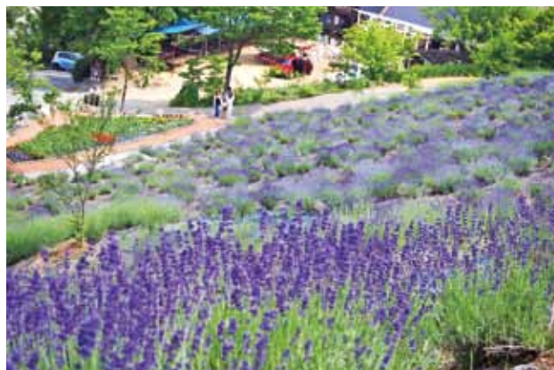
ラベンダーの咲き誇る初夏