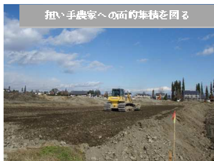
担い手農家への面的集積を図る

整備総合交付金事業 国)152号 小道木バイパス 事 L=1.7Km W=6.5(8.0)m 線形不良区間の解消を図る パス工事を行っています。