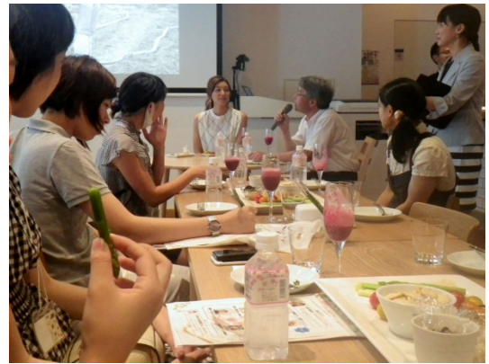
〔農業女子ナチュラル STYLE カフェ〕