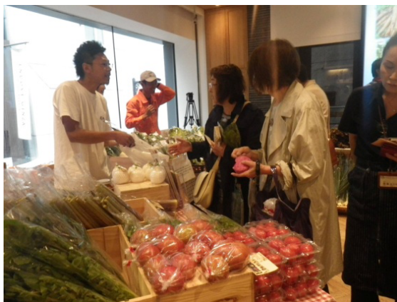
〔しあわせ信州マルシェ〕

川上村産レタス、原村産セルリ 軽井沢町産ズッキーニ等の販売など 6月～10月 7回