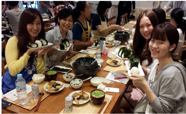
〔しあわせ信州朝クラス〕