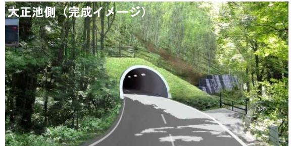
大正池側 (完成イメージ)

落石危険箇所を回避するバイパストンネルの整備により、上高地への安全な交通を確保します。