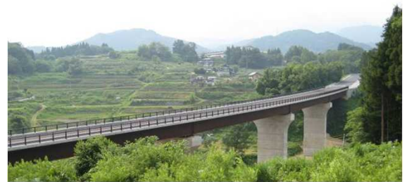
② (国)117号 替佐~静間バイパス

バイパスの整備により、狭隘区間の解消を図ります。これにより、国道18号から上信越自動車道 豊田飯山IC間の改良が完了します。