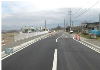
④ (主)丸子東部 しもまるこ インター線 下丸子~長瀬