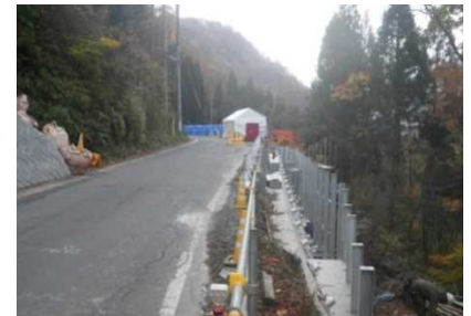
⑤ (国)405号 秋山 あきやま 拡幅