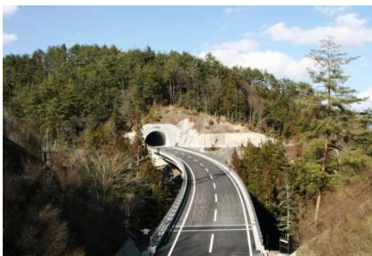
③ (主)天竜公園阿智線 伍和

バイパスの整備により、狭隘区間の解消を図ります。これにより、国道18号から上信越自動車道 豊田飯山IC間の改良が完了します。