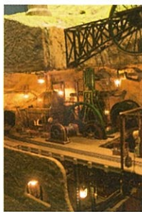
スラッグ映画山模型(天空の城ラピュタ)