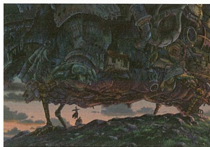
動く城 本編より(ハウルの動く城)