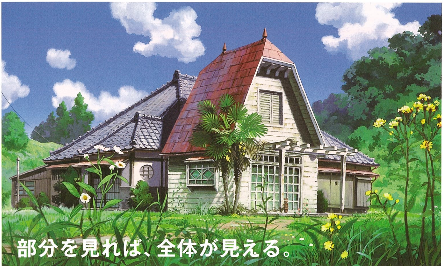
草壁家イメージボード (となりのトトロ)