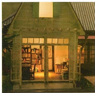
草壁家 模型(となりのトトロ)