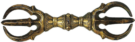
《三鉗杵》南北朝時代～室町時代初期 出雲神社蔵