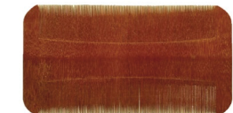
《お六櫛》江戸時代末～明治時代 木祖村教育委員会蔵