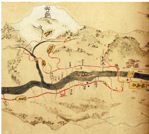
《木曾谷中山川之図》江戸時代 個人蔵・木曾福島郷土館寄託(会期中場面替え)