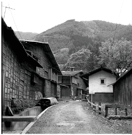
澤田正春《無題(奈良井宿)》昭和時代 王滝村蔵