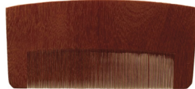
川口助一《お六櫛》昭和時代 木祖村教育委員会蔵