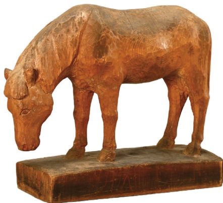
千村士乃武《木曾馬》昭和時代 上松町教育委員会蔵・木曾路美術館寄託