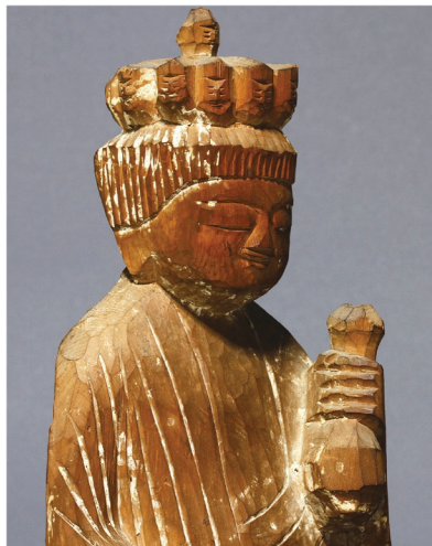
円空《十一面観音坐像》江戸時代 桶守神社蔵

本展では、木曽地域に伝わる、旧石器時代から現代に至る文化財や美術工芸品100件余りを一堂に展示します。美しい自然のもとに現在も引き継がれる第一級の資料をご覧ください、木曽の文化に触れてください。