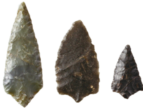
《有舌尖頭器》柳又遺跡出土 旧石器時代末～縄文時代草創期 木曾町教育委員会蔵