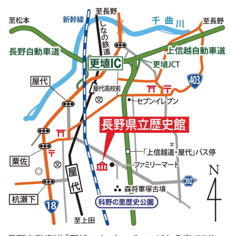
長野自動車道「更埴」インターチェンジから車で5分。しなの鉄道「屋代」駅・「屋代高校前」駅から徒歩25分。