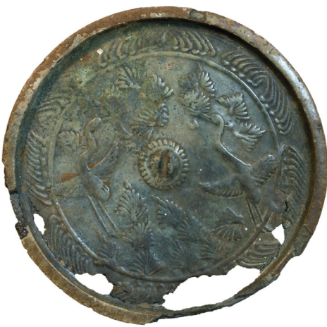
《松喰鶴鏡》平安時代末～鎌倉時代初期 王滝村・御嶽神社蔵