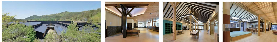
根羽村高齢者福祉施設 ねばねの里 「なごみ」