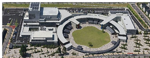
上田市交流文化芸術センター・上田市立美術館 (サントミュージゼ)