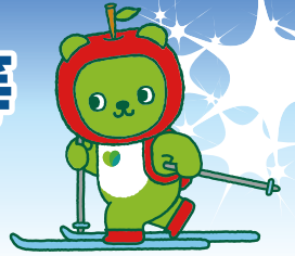
長野県PRキャラクター「アルマ」 ©長野県アルクマ