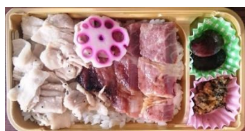
米豚のめし弁当 1,000円

信州サーモンの味噌焼きの香ばしさとコンニクの効いた国産地鶏の山賊焼きが風味豊かなお弁当。