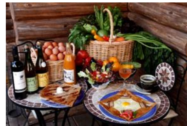
蕎麦粉のガレット (茅野市)