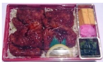
明治亭 鹿肉ソースかつ丼弁当 1,890円

信州の山をイメージした三角形のおにぎりと三角形のからしいなり。郷土の味を再現した温かみのあるお弁当。