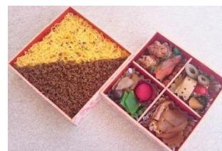
北回廊弁当(二重) 1,450円

製造社：(株)デリクックちくま 信州ポークカツに、信州サーモンの押し寿司など、信州産の食材を彩り豊かに詰め込んだお弁当。