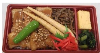
あぶり豚の蕎麦みそ弁当 1,000円

野沢菜ごはんの上に、信州味噌で味付けした信州豚をたっぷり乗せ、蕎麦の実をあしらったボリューム満点のお弁当。