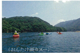
(おんたけ湖カヌー)

長野県の木曾地域(木曾町・南木曾町・王滝村)では、学生の皆さんに「福祉」「観光」「農業」の体験(研修)を通して、職業意識の向上と木曾地域の魅力を知っていただくため“ 地域を挙げて ”インターンシップ研修を実施いたします。皆さんのお越しを、心よりお待ちしております。