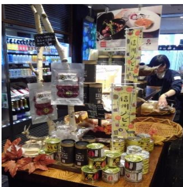
銀座 NAGANO 特設ジビエコーナー