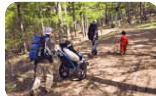
アウトドア用車椅子「HIPPO」 乗車体験