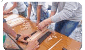
ひのきの箸づくり体験