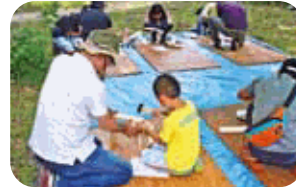
木の椅子づくり体験

山の恵み「木」を使った体験ブースやアロマのハンド・ フットマッサージ、アウトドア用車椅子の体験ができます！ 各ブースへお越しください。