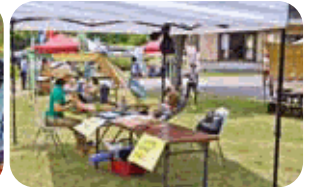
アロマ ハンド・ フットマッサージ