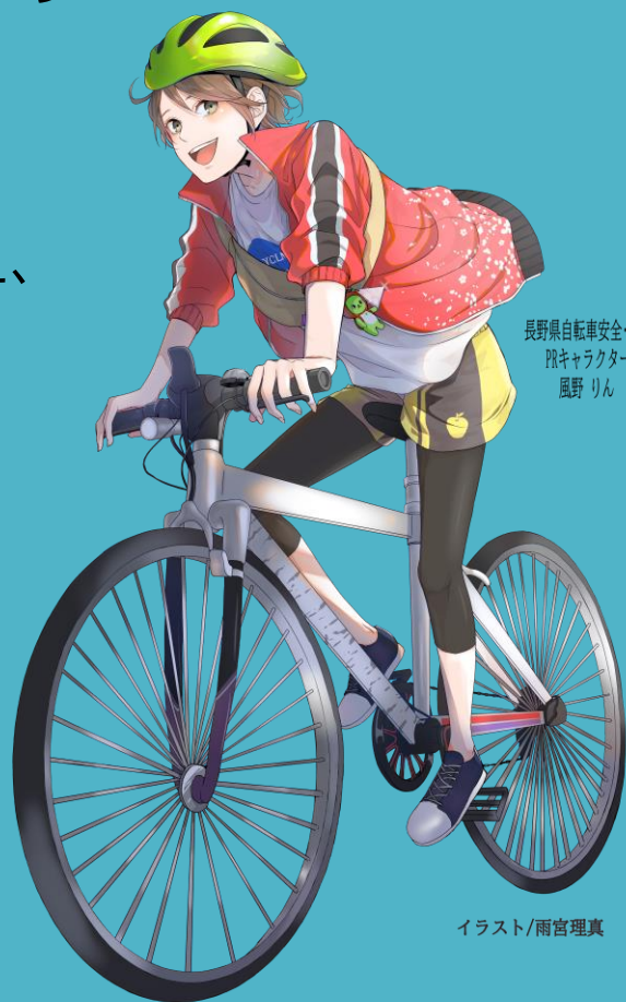
長野県自転車安全・安心 PRキャラクター 風野 りん