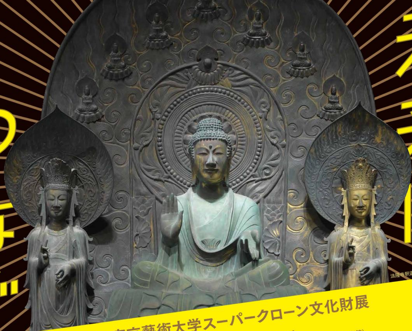
法隆寺釈迦三尊像再現