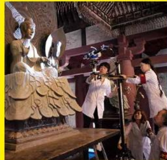
法隆寺釈迦三尊像の三次元計測風景