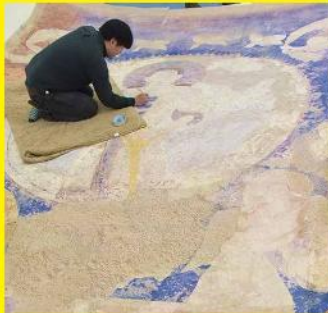
バミヤン東大仏天井壁画再現作業風景