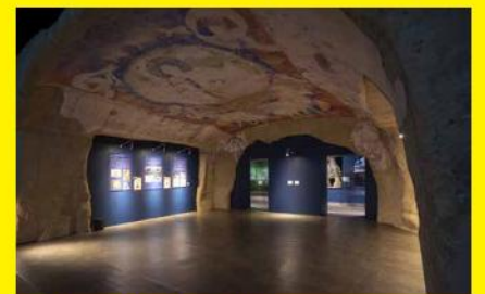
バミヤン東大仏天井壁画 再現

※新型コロナウイルス感染症等、諸般の事情により、会期等に変更が生じる場合があります。最新情報は美術館ホームページをご覧ください。 ※本展の展示作品は、全て撮影が可能です。