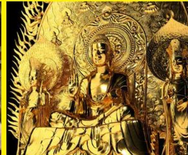
法隆寺釈迦三尊像 復元(CGによる再現)