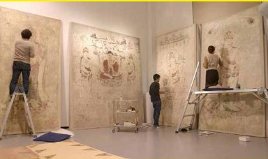
法隆寺金堂壁画再現作業風景