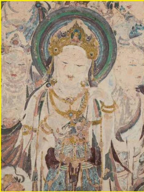
敦煌莫高窟第57窟 再現(部分)