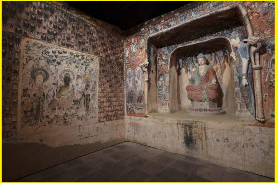
敦煌莫高窟第57窟 再現