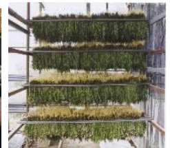
【センブリ: 苦味健胃薬】【乾燥製品】