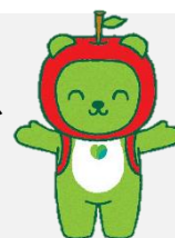
長野県 PR キャラクター「アルクマ」 ©長野県アルクマ